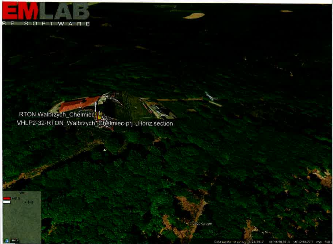
Rys. 2. Rzut poziomy rozkładu pola elektromagnetycznego anteny nowo projektowanej linii radiowej w otoczeniu RTON Wałbrzych Chełmiec przewidzianej do zainstalowania na wysokości 12 m nad poziomem terenu.