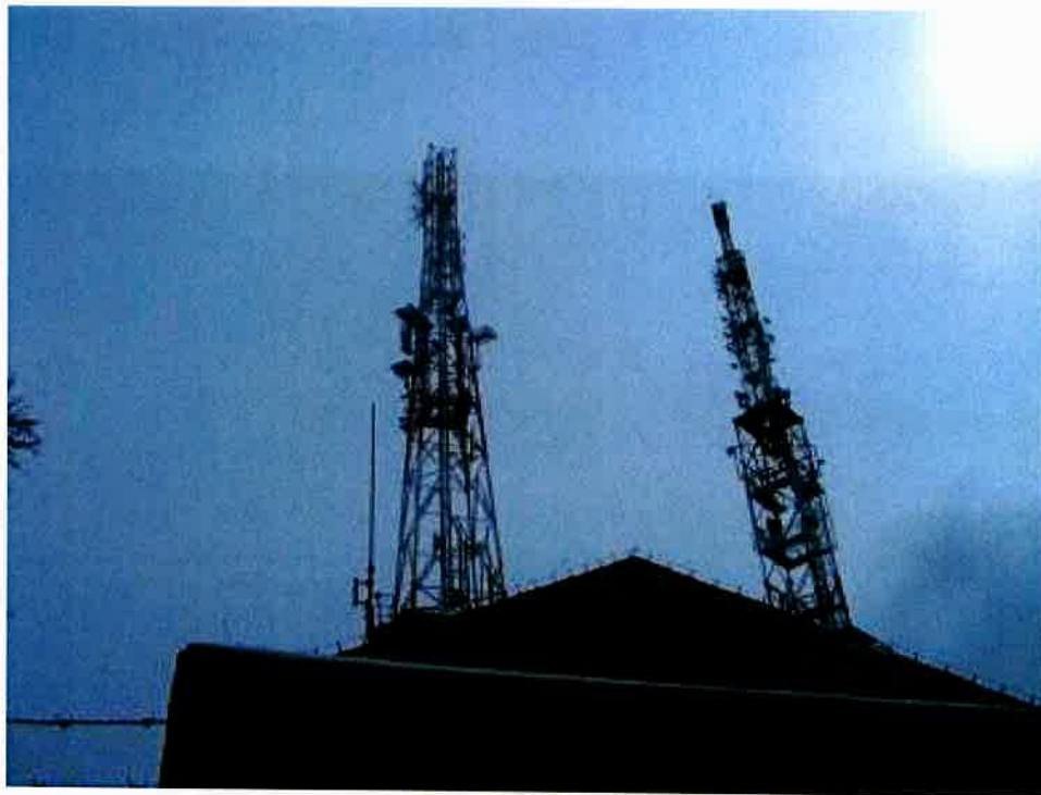
Fot. 1. RTON Wałbrzych Chełmiec – widok obiektu