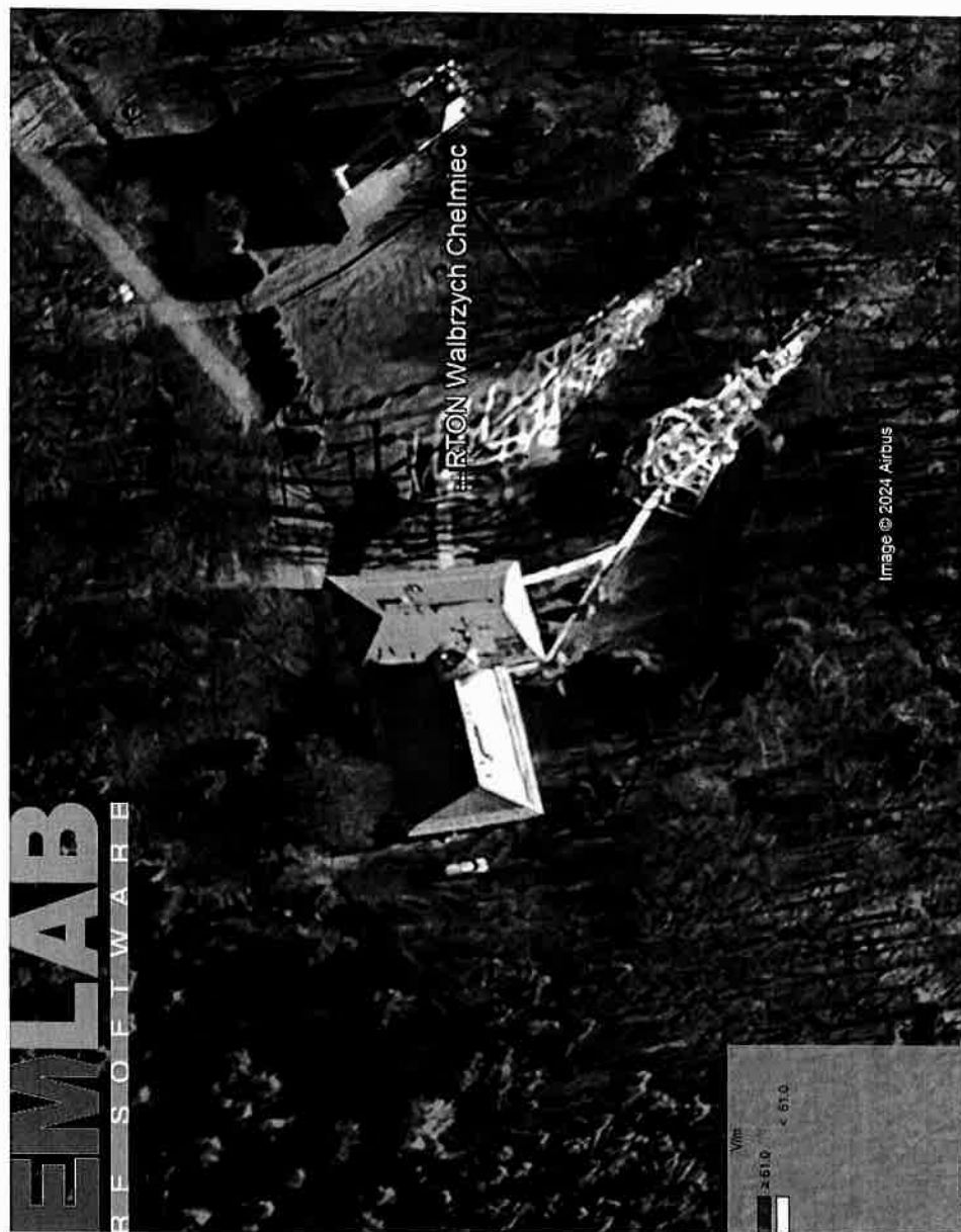
Rys. 2. Rzut poziomy rozkładu pola elektromagnetycznego anteny nowo projektowanej linii radiowej w otoczeniu RTON Wałbrzych / Chelmiec przewidzianej do zainstalowania na wysokości 40 m nad poziomem terenu.