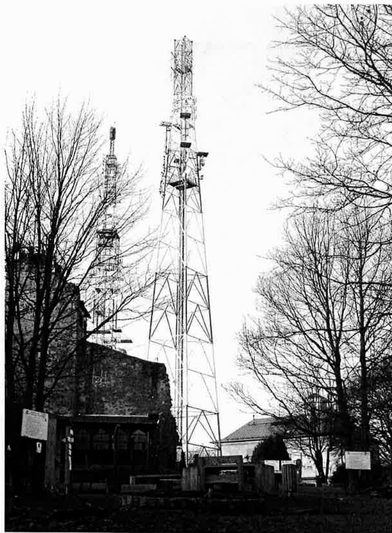
Fot. 1. RTON Wałbrzych / Chełmiec – widok obiektu