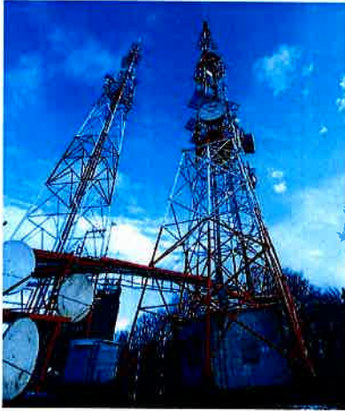
Widok obiektu wraz z zainstalowanym zespołem antenowym