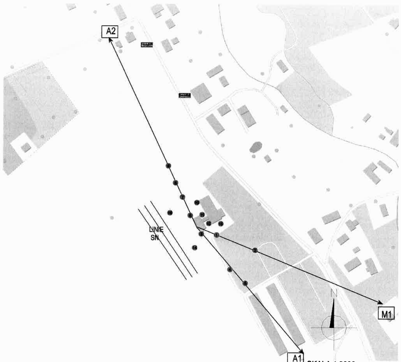
A1 SKALA 1:2000 Azymuty anten T-Mobile