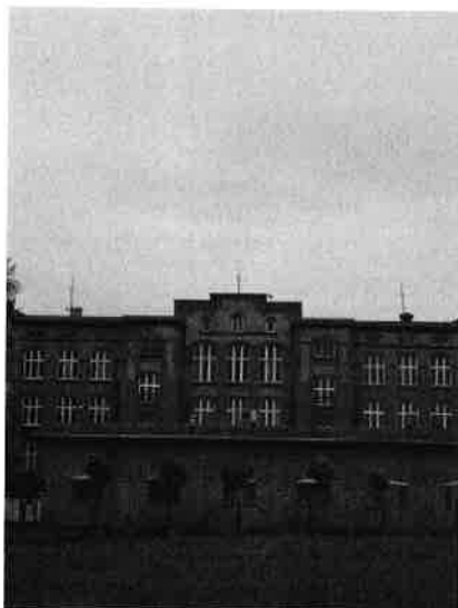
Widok obiektu wraz z zainstalowanym zespołem antenowym