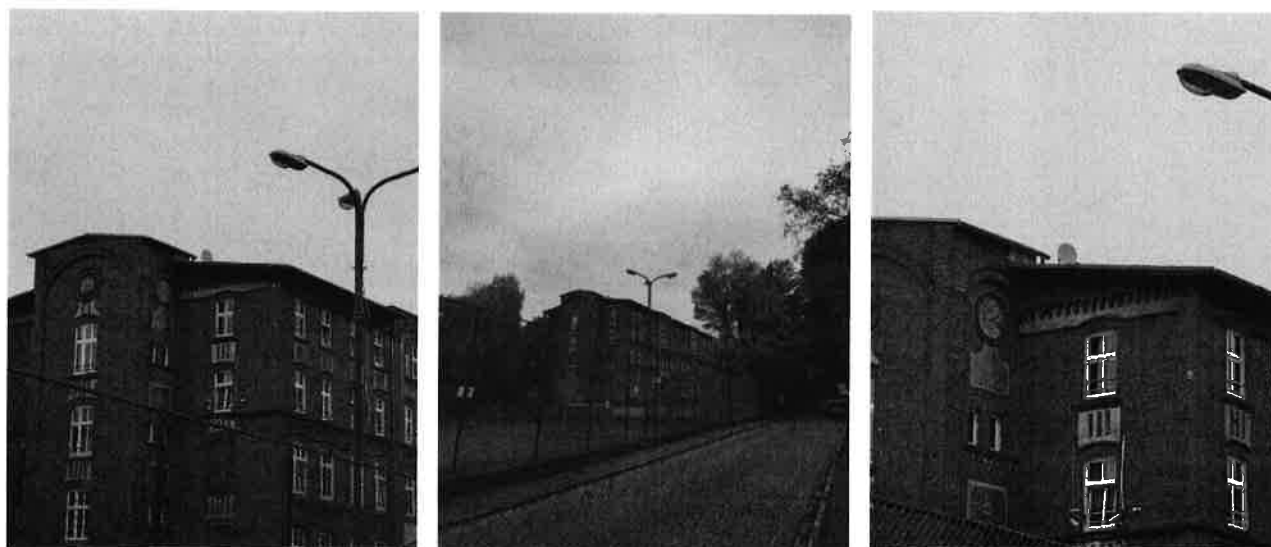
Widok obiektu wraz z zainstalowanym zespołem antenowym