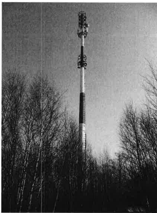
Zal. nr 1: Widok ogólny instalacji radiokomunikacyjnej.