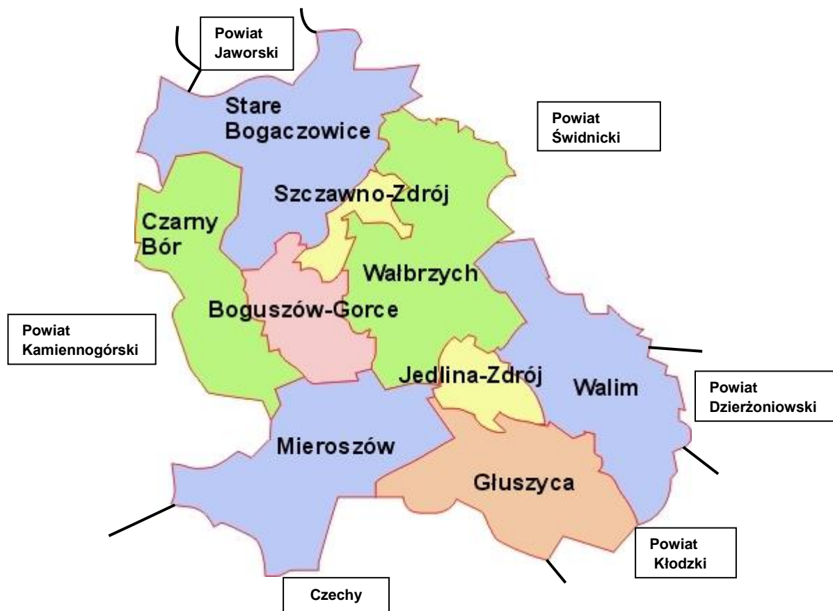
Rysunek 1 - Mapa powiatu wałbrzyskiego.